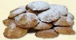
Poffertjes € 1,50