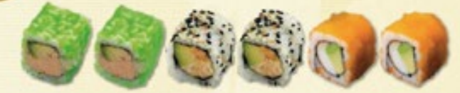
Colour Mix Spicy Tuna (tonijn mousse en avocado, groene viskuitjes) Sake Avocado (zalm mousse en avocado, sesamzaadjes) California Surimi (krab, avocado, oranje viskuitjes) € 6,00