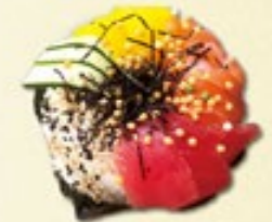
Sushi Donut zalm, avocado, mango, viskuitjes, sesamzaadjes, zeewier, Japanse mayonaise € 7,00