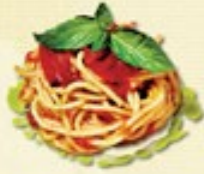
Spaghetti Pomodori € 3,00