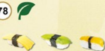
Veggie Nigiri Mix tamago (omelet), mango, avocado € 4,50