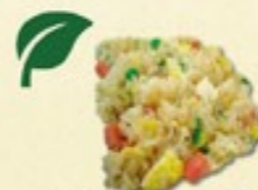
Gebakken Rijst € 2,00