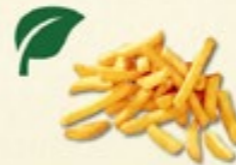
Friet € 1,50