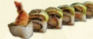
Dragon Roll (6 st.) gefrituurde garnaal, avocado € 7,00