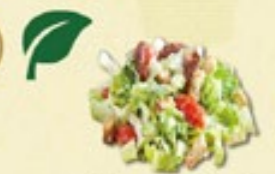
Frisse Salade € 2,00