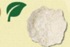
Witte Rijst € 1,50