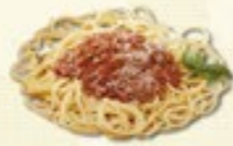
Spaghetti Bolognese € 3,95