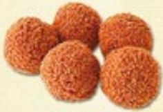
Bitterballen € 1,50