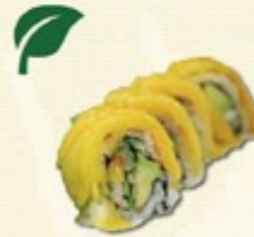
Fruit Roll (6 st.) komkommer, meloen, mango en avocado € 6,00