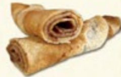
Pannenkoek € 1,50