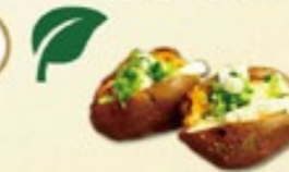
Gepofte Aardappel € 1,50