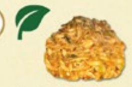
Gebakken Noodles € 2,00