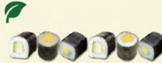
Veggie Maki Mix kappa (komkommer), tamago (omelet), avocado € 4,50