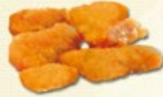
Kipnuggets € 1,95